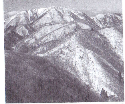
御在所岳から望む雨乞岳

湯の山温泉街の坂道を登り、表道の道標に従い大石公園の石段を上がって舗装路に出て橋を渡る。しばらく歩くと